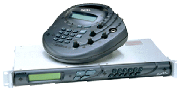
Matrix Portátil y el Matrix Rackmount