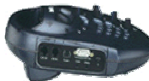
Vista del Matrix Portátil con los conectores para teléfono