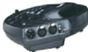
Vista posterior del Matrix Portátil con los conectores para audio