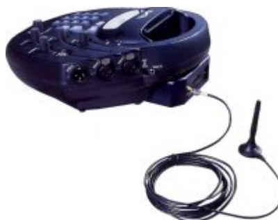
Matrix Portátil con el Módulo GSM